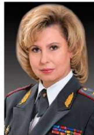
Татьяна Николаевна Москалькова – уполномоченный по правам человека в России с 2016 г.

Инициатором Единого урока права выступил Уполномоченный по правам человека в Российской Федерации Т.Н. Москалькова при поддержке уполномоченных по правам человека в 85 субъектах Российской Федерации, Минобрнауки России и Временной комиссии Совета Федерации по развитию информационного общества.